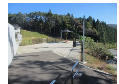
細浦防災集団移転