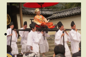
太閤秀吉、醍醐寺に現る