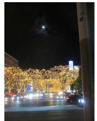
仙台光のページェントと浮かぶ月

ある意味当たり！細浦は同じ番号で2回線ありましたが、今は1回線のみ。話し中なら時間をおいて掛け直して下さい。また被災後の携帯番号は今は使いません。固定電話にかけて下さい。