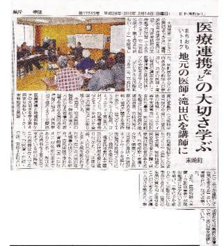
東海新報にも掲載