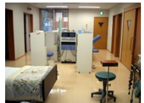
懐かしい細浦の「電気部屋」 (処置室)

ゆっくり良く噛んで食べると、人間の満腹中枢は満足し結果的に食べる量は少なくて済みます。胃腸への負担も減ります。年に見合った食事をしましょう。