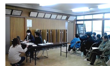
ふるセン時代の当院

●保険診療は必ず診察が必要です。これは法律で決まっています。毎回薬だけでは困ります。